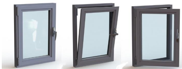
Bild nedan visar vänsterhängt fönster.